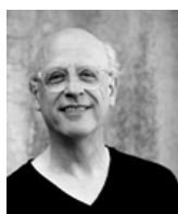
Alain Goudard

Basé à Nancy, l'ensemble est invité à se produire dans divers festivals et saisons musicales en Europe.