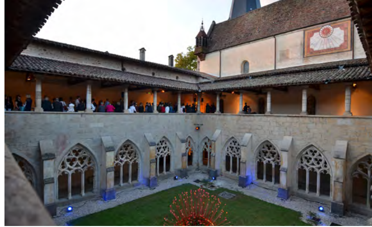
CCR d'Ambronay