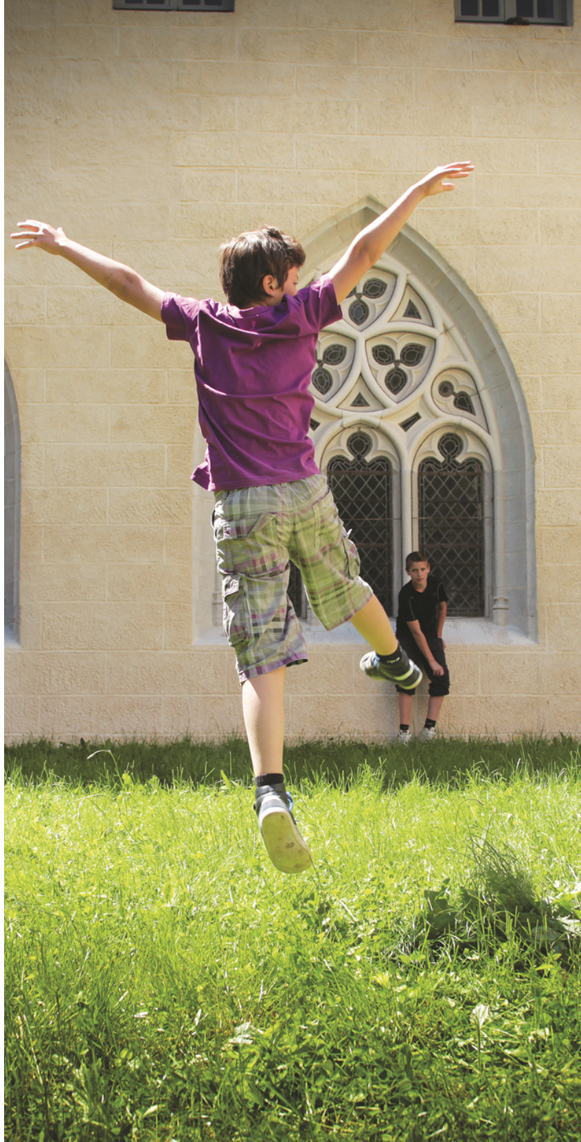
CCR d'Ambronay

RÉSONANCE PRÉAC Opéra et Expressions vocales Festival d'Ambronay // 4 octobre 2019