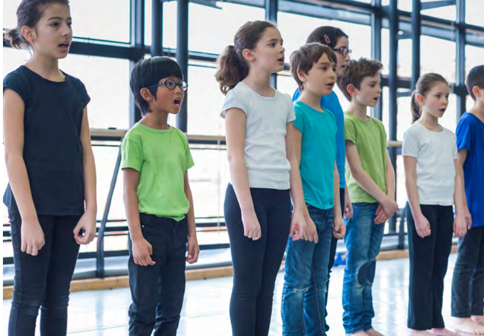
© Blandine Soulage – Opéra de Lyon