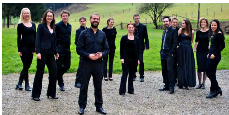
L'Achéron © Juliette Pacquier

Dans la mythologie grecque, L'Achéron est le fleuve que traverse Orphée pour secourir Eurydice aux Enfers. Comme son nom l'inspire, L'Achéron veut ouvrir une voie entre deux mondes apparemment opposés : celui des vivants et des défunts, le passé et le présent, l'idéal et la réalité. Fondé en 2009 par François Joubert-Caillet, L'Achéron est constitué d'une jeune génération de musiciens ayant été formés dans les plus grandes écoles de musique ancienne (Schola Cantorum de Bâle, Conservatoires nationaux supérieurs de Lyon et Paris, les Conservatoires royaux de Bruxelles et La Haye, etc.).