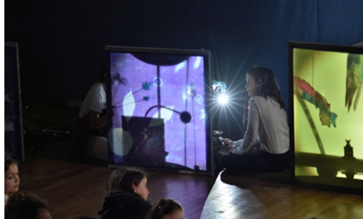
Les arts caméléons – L'Arbre Canapas