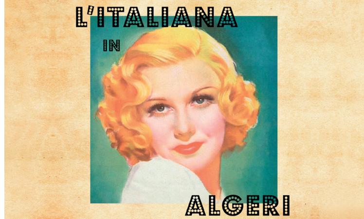
L'Italienne à Alger - Affiche du spectacle