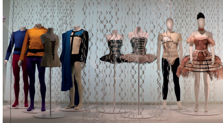
Exposition Couturiers de la danse, salle 9, « Pas si classique »